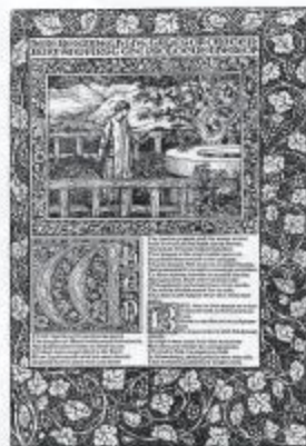
「チョーサー作品集」 バーン＝ジョーンズ画 (1896年)

In 1859 Morris married artist's model, Jane Burden. He immediately engaged his friend, Philip Webb, of the architectural office of G.E. Street, where he himself worked for a time, to build a home for Jane and himself. This was the famous Red House, named for its red bricks, which also became the center for the partnership of Morris and his friends, Edward Burne-Jones, Dante Gabriel Rossetti, and Webb. They collaborated on the design and commissioning of furniture and interior decorations, handling everything right up to the sale of their creations.