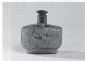
エミール・ガレによる ガラス小びん (1890年頃)

アーツ・アンド・クラフツ運動は、ヨーロッパ大陸やアメリカへ波及し、その伝統は現在でもギルド制としていくつかの国で継続されている。同運動は、実は日本へも影響し、それは民芸運動(1926~1945年)と呼ばれた。柳宗悦、浜田庄司、富本憲吉と、バーナード・リーチを介して黒田辰秋、棟方志功、芹沢銈介等の工芸作品に影響がみられる。