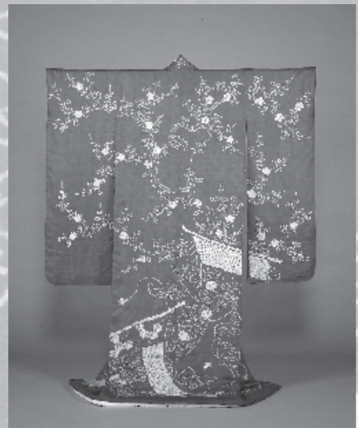
紅綸子地梅御簾模様振袖